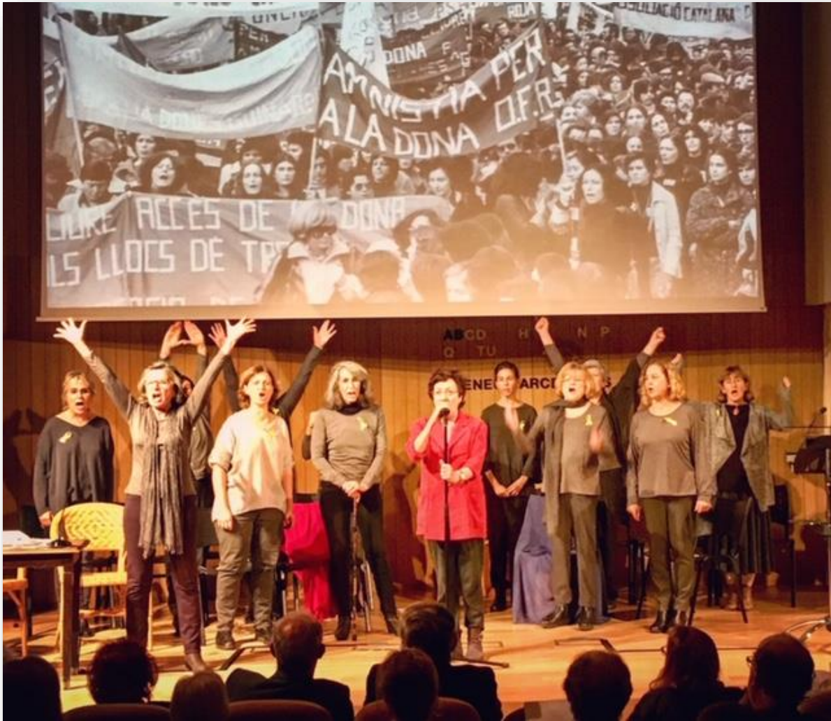
Quadre final de Que els seus Noms NO s'esborrin de la Història

Imatge de l'estrena el 28 d'octubre de 2019 a la Sala Bohigas de l'Ateneu Barcelonès